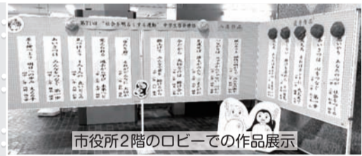
市役所2階のロビーでの作品展示

市内4つの中学校より、合わせて1062人の生徒から1259編の応募があり、標語選考委員会において、優秀作品5編と入選作品10編を決定しました。