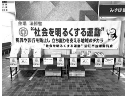
市役所2階のロビー展示

団体や地域に密接に結びついている団体により推進委員会を組織しています。今年度も新型コロナウイルス感染症拡大防止のため、拍江市推進大会やコンサート等のイベントは中止となりましたが、中学生啓発標語の募集は再開しました。たくさんの方の作品をご応募いただき、優秀作品及び入選作品については、市役所2階ロビーに展示しました。