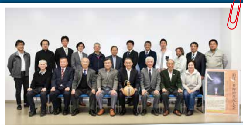
実行委員会の皆さんより みんなで協力して来年こそは多摩川の夏の夜空に大輪の花を咲かせましょう!