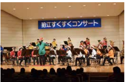
親子で聴きにきてください