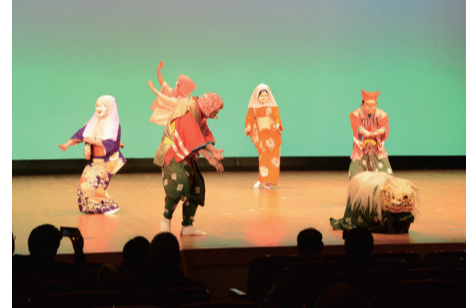
多摩川流域の郷土芸能をお楽しみください