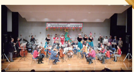
音楽でクリスマス気分を満喫しよう