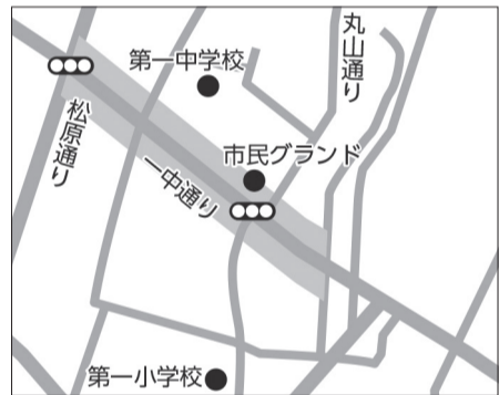
■一中通り沿道地区対象地

公告日11月19日(月) 期間11月19日(月)～12月3日(月) (土・日曜日、祝日を除く)