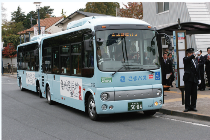
平成20年11月24日 この日からこまバスの歴史が始まりました

※また、11月18日(日)に行われる市民まつりでも記念イベントとして、車両を展示します。