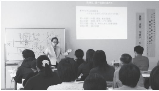
採用側の目線で就職面接を考えます