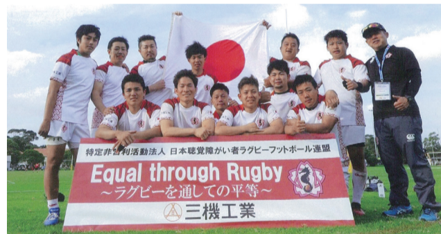
今年の世界大会第4位のデフラグビー日本代表

定 小学生40人 親子での参加も歓迎 申 住所・氏名（ふりがな）・小学校名・学年・電話番号・メールアドレスを ☒komae.rugby1@gmail.com で狛江市ラグビーフットボール協会 ☎(3489)7776へ。