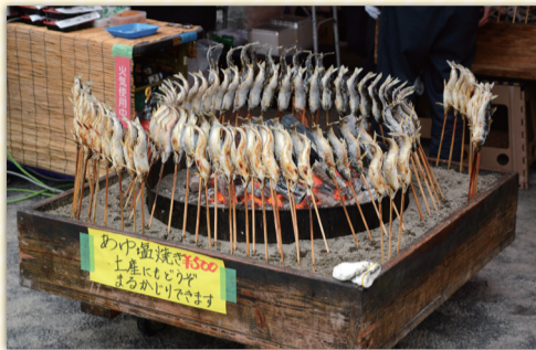
おいしい産地直売を楽しみにお越しください

友好都市の新潟県長岡市川口地域と山梨県小菅村をはじめとした各地の物産や市民による出店