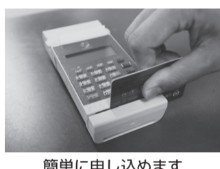
簡単に申し込みます

窓口で依頼書に記入し、専用端末機にキャッシュカードを通して暗証番号を入力するだけで、口座振替の申し込みができます。 対象市税 市民税・都民税(普通徴収)、固定資産税・都市計画税、固定資産税(償却資産分)、軽自動車税、国民健康保険税 持 ▽利用可能金融機関のキャッシュカード(本人名義に限る) ▽本人を確認できるもの(健康保険証・運転免許証等) 利用可能金融機関 みずほ銀行、三菱UFJ銀行、三井住友銀行、きらぼし銀行、ゆうちょ銀行(郵便局) 申 問 納税課へ。