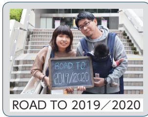
ROAD TO 2019/2020