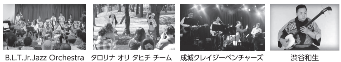
B.L.T.Jr.Jazz Orchestra タロリナ オリ タヒチ チーム 成城クレイジーベンチャーズ 渋谷和生

受 9時20分から 所 緑野小学校 対 主に小学生以上の方(未就学児は保護者同伴。介助が必要な方は介助者同伴) 定 先着30人程度(参加20人、見学10人) 持 上履き(スリッパ) 申 問 9月2日(日)午前9時から20日(木)午後7時までに、音楽の街-狛江エコルマ企画委員会事務局(一般財団法人狛江市文化振興事業団 ☎(3430)4106(火曜日休館))へ。