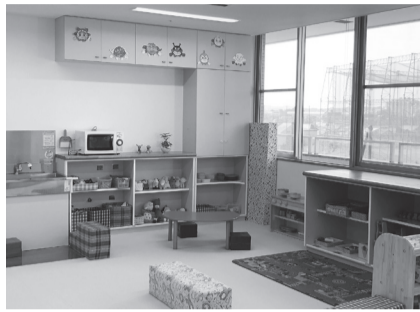
仮移転後の子ども家庭支援センター

※岩戸児童センターの改修工事に伴い8月から平成32年2月(予定)までの間、あいとぴあセンターに移転しています。