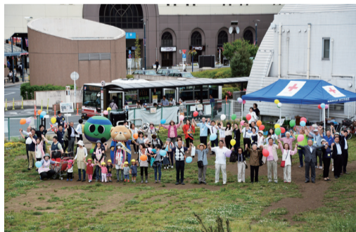
平和を祈り、みんなで手をつなごう

昭和20年5月25日に狛江市で空襲がありました。当時空襲のあった場所で「みんなの輪」写真を撮ります。ぜひお気軽にお越しください。 ■メビウス8えきま広場 ☎5月25日(金)午前11時から ▽パフォーマンス ☎午前10時30分から ☎Ee(歌)、マイケル・ジャクソントリビュートパフォーマーマーク(ダンス)、Sing er haru(歌) ■市役所前市民ひろば ☎5月25日(金)午後3時から ▽パフォーマンス ☎午後2時45分から ☎紙しばいやもちい(パルーンアート付き紙芝居)