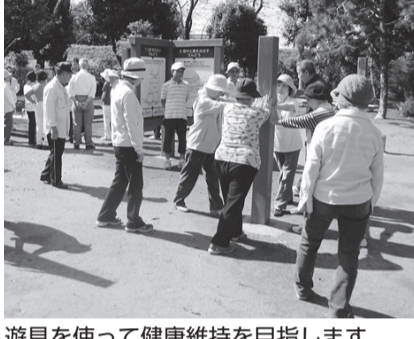
遊具を使って健康維持を目指します

楽しみながら気軽に運動できる「うんどう教室」を市内4カ所の公園で実施しています。うんどう教室に参加して運動の習慣を付けませんか。 65歳以上の方 体力測定会 うんどう教室に参加していない方も、ぜひご参加ください。 6月1日(金)午後2時〜3時30分 所上和泉地域センター 対市内在住の65歳以上の方