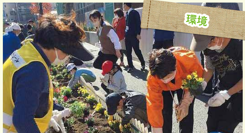
※活動内容は町会・自治会によって異なります。