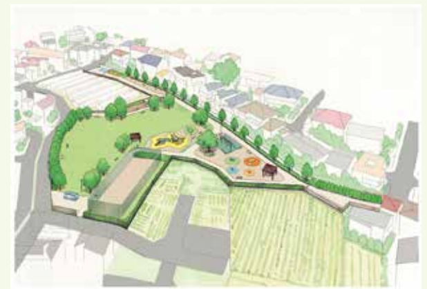
(仮称)駒井公園イメージ図