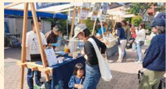
えきまえ広場で開催されたパンマルシェの様子