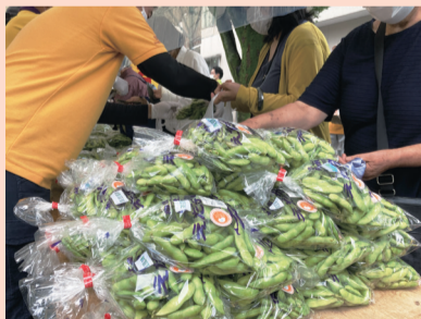
旬の採れたて狛江産枝豆をご賞味ください