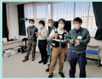
市職員向けドローン体験会の様子