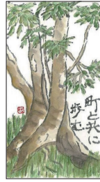
「絵手紙発祥の地—狛江」 公募展受賞作品