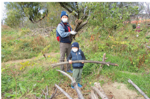
みんなできれいにしよう

令和元年東日本台風による増水で流れてきた、わらごみや流木がまだ片付いていません。皆さんのご協力をお願いします。 日1月10日～31日の毎週日曜日(時)午前10時～正午(雨天中止) 集合(所)狛江水辺の楽校入口 (内)水辺の楽校の清掃、散策路の草刈りや小川の丸太橋づくり(持)動きやすく汚れてもよい服装・靴(長袖・長ズボン・長靴など)、軍手、タオル、飲み物、着替え、お持ちの方はのこぎり、草刈り鎌など 岡竹本 ☎090(3525) 8506