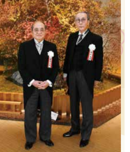
木村大作監督(右)と文化功労者顕彰式会場で撮影

すけど、今では世界中で使われています。私が研究を始めた時はまだロボットがありませんでした。簡単に言えば、工場の生産機械・自動車、鉄道・家電製品など、電気で作る機械を制御することを「メカトロニクス」と言います。 市長 なるほど。例えば、我々が普段乗っている自動車もさまざまな部品が複雑に組み合わさっています。それぞれの部品は機械操作のみで動いているわけではなく、「メカトロニクス」、つまり電気で作る制御することによって、より高度な動作をすることが可能になっているわけですね。自動車だけに限らず、家電製品をはじめとして、日常生活の中で私たちが意識せずに当たり前のようになっているものも多く、実は原島先生の研究成果の恩恵を受けているんです。 原島 私が研究を始めた50年くらい前は、エレクトロニクス(電気)の方がずっと遅れていました。ITもデジタルの技術も、ましてコンピューターもない。