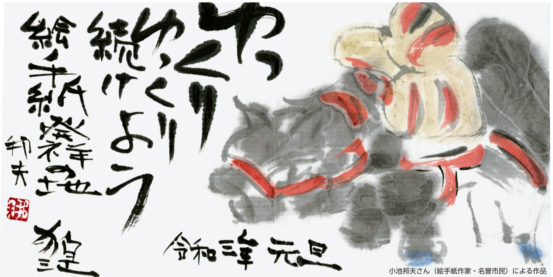
小池邦夫さん（絵手紙作家・名誉市民）による作品