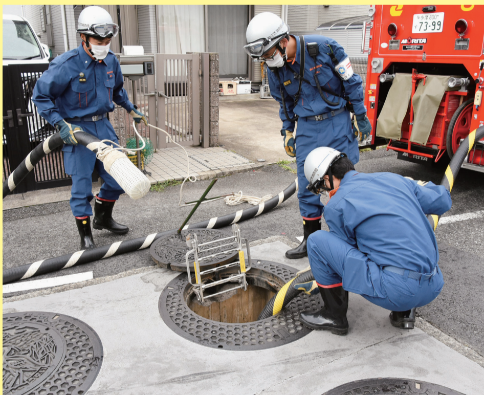
市内にたまった雨水を多摩川に排水する訓練