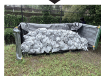
ぜひご活用ください