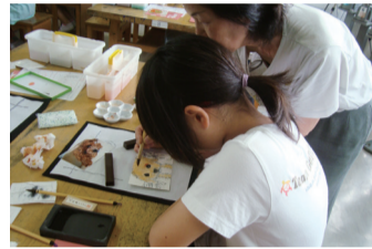
昨年の絵手紙教室の様子