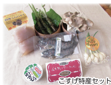
こそげ特産セット