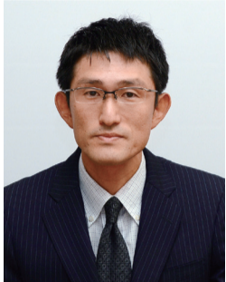
午後1時～4時（要予約） 秘書広報室へ。 政策室協働調整担当