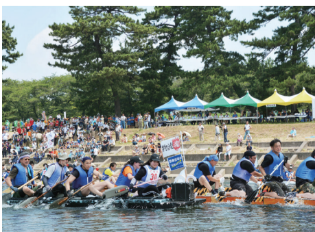
熱いレースとおいしい枝豆で夏を感じませんか