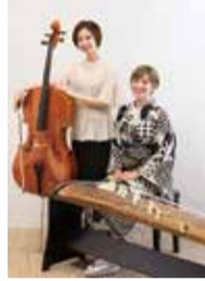
～箏とチェロの物語～