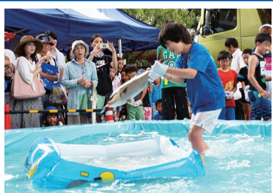
カンパチを捕まえよう