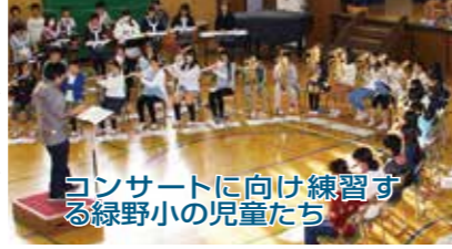
コンサートに向け練習する緑野小の児童たち

出演する子どもたちは、大きな舞台での演奏に向けて現在、熱心な練習を重ねている。入場は無料で、主催者は「ゼ