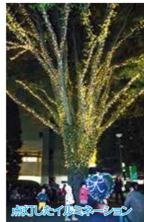
点灯したイルミネーション

狛江市役所前市民ひろばのケヤキがイルミネーションで飾られ、夜の街を輝きとぬくもりで彩っている。