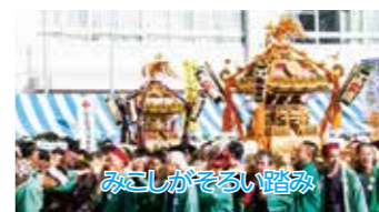
みこしがそるい踏み

本町通りではパレード、みこしや民謡流し踊りが練り歩き、祭ムードを盛り上げた。一小ステージでは2020年の東京オリンピック・パラリンピックのフラッグが披露されたほか、山梨県小菅村との住民交流友好都市10周年を記念した小菅村の郷土芸能「大菩薩御光太鼓」の演奏などが人気を呼んだ。このほか、新潟県長岡市川口地域などの物産展、市民団体や市内の飲食店などが手作り品や食べ物などを販売、多くの人でにぎわった。また、宝船の宝分けや市内産野菜の即売には長い列ができていた。