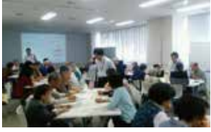
昨年の防災カレッジの様子