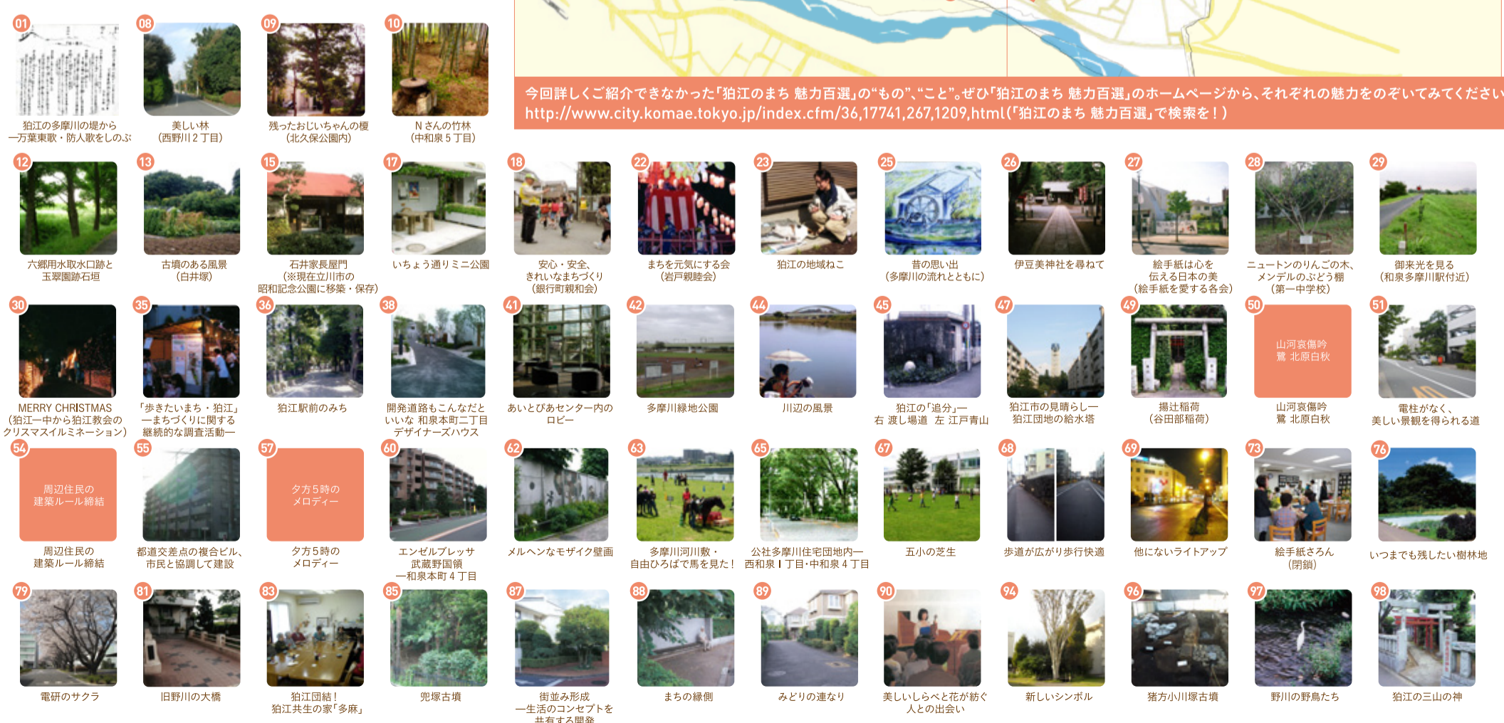
01 狛江の多摩川の堤から 一万葉東歌・防人歌をしのぶ 08 美しい林 (西野川2丁目) 09 残ったおじいちゃんの櫻 (北久保公園内) 10 Nさんの竹林 (中和泉5丁目) 12 六郷用水取水口跡と 玉翠園跡石垣 13 古墳のある風景 (白井塚) 15 石井家長屋門 (※現在立川市の 昭和記念公園に移築・保存) 17 いちょう通りミニ公園 18 安心・安全、 きれいなまちづくり (銀行町親和会) 22 まちを元気にする会 (岩戸親睦会) 23 狛江の地域ねこ 25 昔の思い出 (多摩川の流れとともに) 26 伊豆美神社を尋ねて 27 絵手紙は心を 伝える日本の美 (絵手紙を愛する各会) 28 ニュートンのりんごの木、 メンデルのぶどう棚 (第一中学校) 29 御来光を見る (和泉多摩川駅付近) 30 MERRY CHRISTMAS (狛江一中から狛江教会の クリスマスイルミネーション) 35 「歩きたいまち・狛江」 一まちづくりに関する 継続的な調査活動 36 狛江駅前のみち 38 開発道路もこんなだ といいな 和泉本町2丁目 デザイナーズハウス 41 あいとびあセンター内の ロビー 42 多摩川緑地公園 44 川辺の風景 45 狛江の「追分」 右 渡し場道 左 江村青山 47 狛江市の見晴らし一 狛江団地の給水塔 49 揚辻稲荷 (谷田部稲荷) 50 山河哀備吟 鶯 北原白秋 51 電柱がなく、 美しい景観を得られる道 54 周辺住民の 建築ルール締結 55 周辺住民の 建築ルール締結 57 クラ5時の メロディー 60 エンゼルブレッサ 武蔵野国境 一和泉本町4丁目 62 メルヘンなモザイク壁画 63 多摩川河川敷 自由ひろばで馬を見た! 65 公社多摩川住宅団地内一 西和泉1丁目・中和泉4丁目 67 五小の芝生 68 歩道が広がり歩行快適 69 他にないライトアップ 73 絵手紙さん (閉鎖) 76 いつまでも残したい樹林地 79 電研のサクラ 81 旧野川の大橋 83 狛江団結! 狛江共生の家「多麻」 85 兜塚古墳 87 街並み形成 一生活のコンセプトを 共有する開発 88 まちの緑側 89 みどりの連なり 90 美しいらべと花が紡ぐ 人との出会い 94 新しいシンボル 96 猪方小川塚古墳 97 野川の野鳥たち 98 狛江の三山の神

今回詳しく紹介できなかった「狛江のまち 魅力百選」の「もの」「こと」。ぜひ「狛江のまち 魅力百選」のホームページから、それぞれの魅力をのぞいてみてください。 http://www.city.komae.tokyo.jp/index.cfm/36,17741,267,1209,html （「狛江のまち 魅力百選」で検索を！）