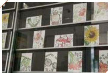
狛江郵便局内の「狛江ミニギャラリー」では、季節感あふれる絵手紙を展示。