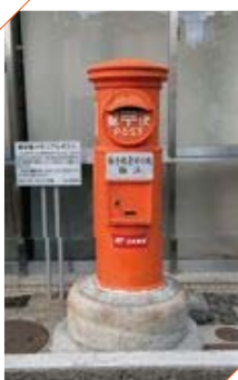
「絵手紙メモリアルポスト」 狛江市和泉本町三丁目29番7号 (問)03-3488-4242(狛江郵便局)