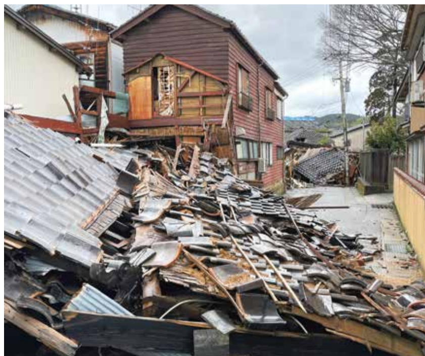
石川県輪島市の被害状況（令和6年2月）