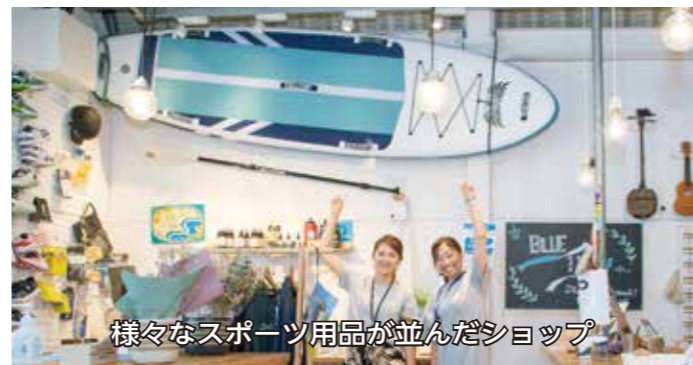
様々なスポーツ用品が並んだショップ

☎3430-3117 東和泉4-11-21、営業時間=平日午前9時～午後9時30分、土曜午前8時～午後7時、日曜・祝日午前8時～午後6時、金曜日休み