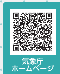
気象庁ホームページ