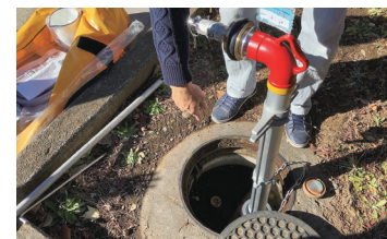
応急給水栓からの給水