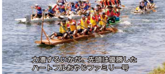
力漕するいかだ。先頭は優勝したハートフルおやじファミリー号

「狛江古代カップ多摩川いかだレース第30回記念大会」(同実行委員会主催)が7月24日(日)に催され、手作りのいかだ81艇がスピードやデザインを競った。当初は17日(日)の予定だったが、開催前に降った雨の影響で1週間延期となった。