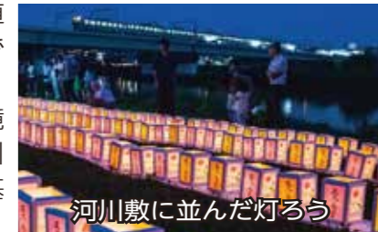
河川敷に並んだ灯ろう