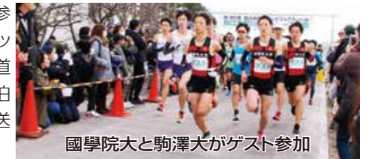
國學院大と駒澤大がゲスト参加