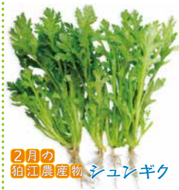
2月の 猪江農産物 シュンギク

シュンギクは11月から3月頃が旬。一般的なキクと違い、春に花が咲くことからこの名がついた。鍋物でなじみ深く、おひたしなどの和食が中心だが、肉料理やパスタなどの西洋料理にも使われる。独特の香りがあり、ビタミンAとCを豊富に含む緑黄色野菜。猪江市内でも多くの農家が栽培している。葉の緑色が濃く、葉先がピンとしているものを選ぶと良い。保存するときは乾燥しないよう新聞紙などでくみ、ビニール袋などに入れて冷蔵庫へ。