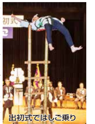
出初式ではしご乗り

第50回猪江多摩川ロードレース大会は猪江高校西側をスタート地点に多摩川堤防上に設けた1*、2*、3*、5*、10*のコースで行われ、小学生や市民ランナーなど451人が新春にふさわしい青空の下で健脚を競った。レースには駒澤大学と國學院大学の陸上競技部もゲストで参加、ダイナミックな走り道沿道から大きな拍手や声援が送られていた。