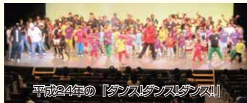
平成24年の『ダンス!ダンス!ダンス!』

4階ホールでは公募12チームによるJump up stage、猪江高等学校ダンス部、猪江第二中学校ダブルダッチ部有志、コマエンジェルなど市内外で活躍する注目の12チームによるPick up stage、プロのダンサー7チームが出演するProfessional stageなど5部構成。6階展示・多目的室ではワークショップ、ミニライブなどが行われる。