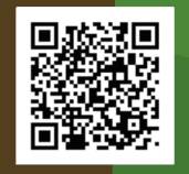
こまえ子育てねっと