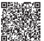
フッ素塗布 チケット

※フッ素塗布は実施医療機関で行っております。フッ素塗布チケットを持参の上実施医療機関で受診してください。チケットをお持ちでない方は電子申請か健康推進課へご連絡ください。詳細はホームページをご覧ください。