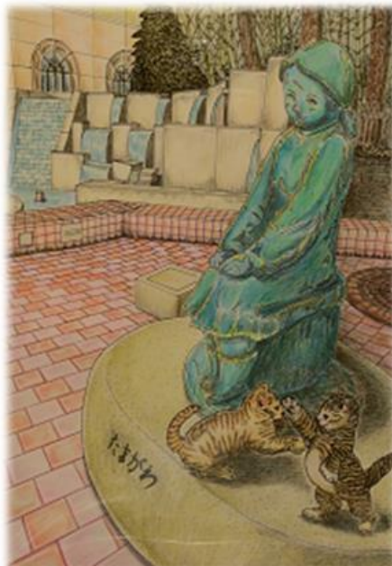
こまえの魅力創作展応募作品「愛しおまなざし」