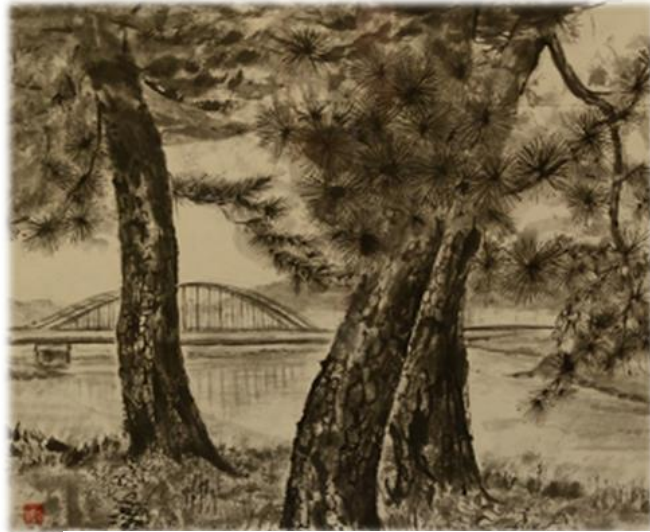
こまえの魅力創作展 優秀賞「時の流れ」