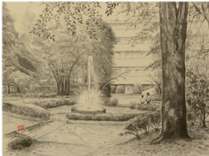
こまえの魅力創作展応募作品「散歩道の西河原公園」