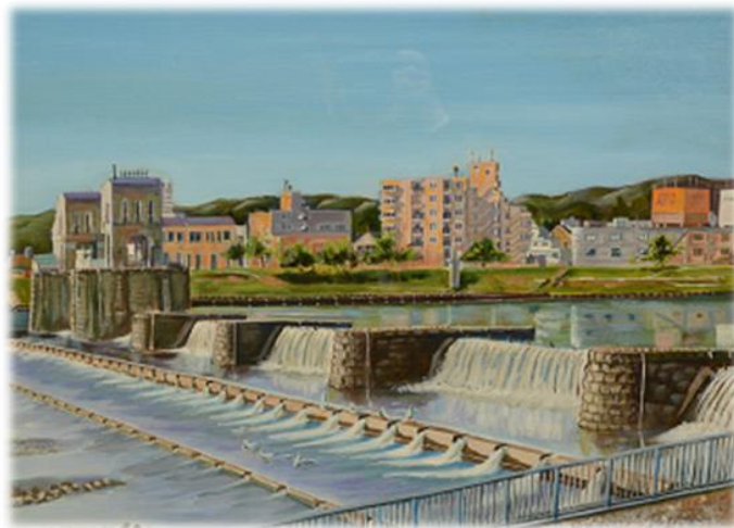
こまえの魅力創作展 最優秀賞「多摩川下流堰を望む」