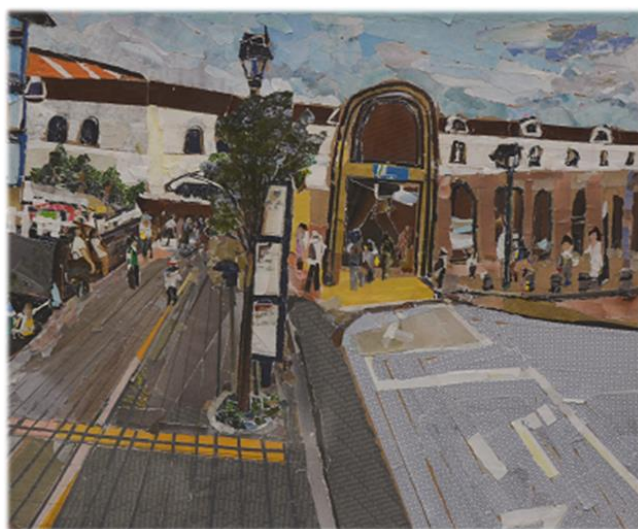
こまえの魅力創作展 特別賞「高架線となった狛江駅」