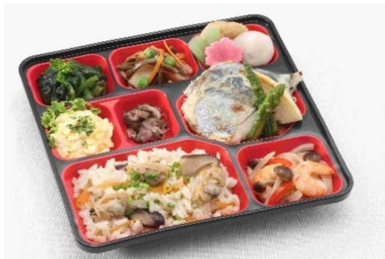
まいにち七菜ごはん付きの例

※「2食以上価格」の記載があるものは、種類・組合せに関わらず、1日2食以上の注文で表記の価格になります。