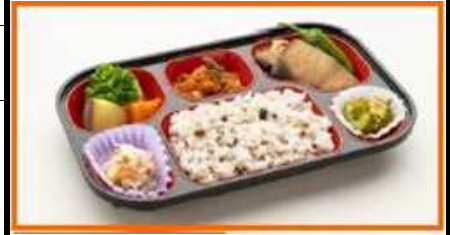
お弁当コースの例

選べる3コース、どのコースも、和、洋、中を組み合わせた、管理栄養士が監修した日替わりメニューでお届けします。