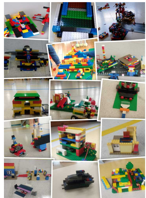
(子どもたちのレゴブロック作品)