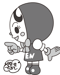
人権イメージキャラクター 人KENあゆみちゃん