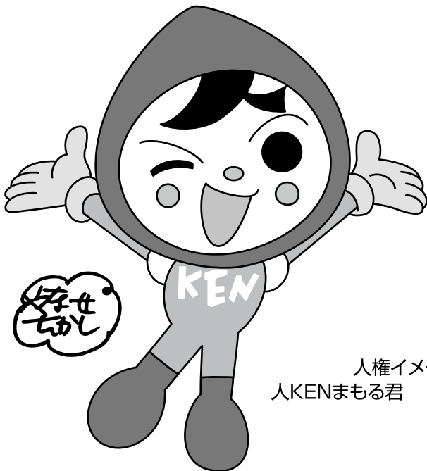
人権イメージキャラクター 人KENまもる君 人KENあゆみちゃん