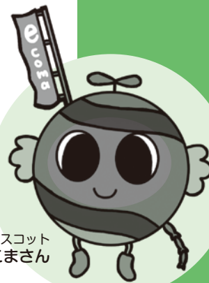
狛江市環境マスコット えこまん