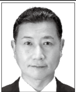
よしかず たるい 良和 元衆議院議員 表現の自由を守る・ 日本V字回復やったるい