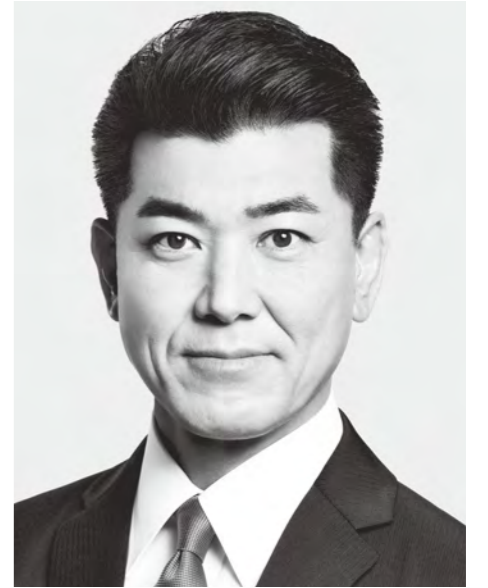
立憲民主党 代表 泉 健太