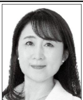
やた わか子 国民民主党 副代表 あなたと動けば、 未来は変わる。