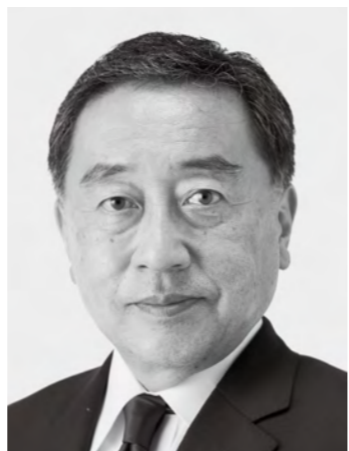
うえだ 上田 いさむ 新 元財務副大臣。東京大学農学部卒。米国コーネル大学大学院経営学修士号取得。63歳。