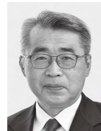
みやざき 宮崎 まさる 現1 前環境大臣政務官。党環境部会長。埼玉大学工学部卒。64歳。