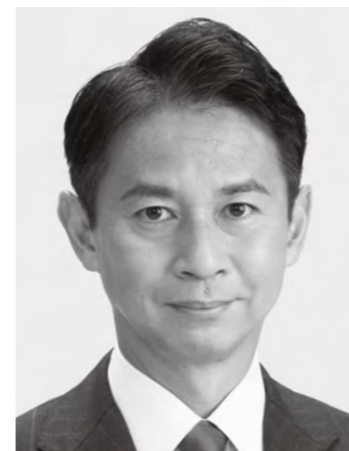
たに まさあき 谷 あい 正明 現3 元農林水産副大臣、党参議院幹事長。京都大学大学院修士課程修了。49歳。