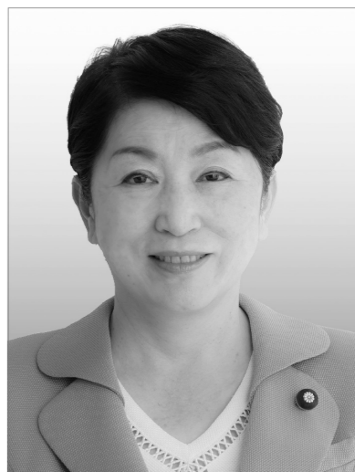
社民党党首 福島みずほ