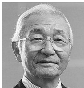
人生最後・80歳の挑戦 新党呼びかけ人