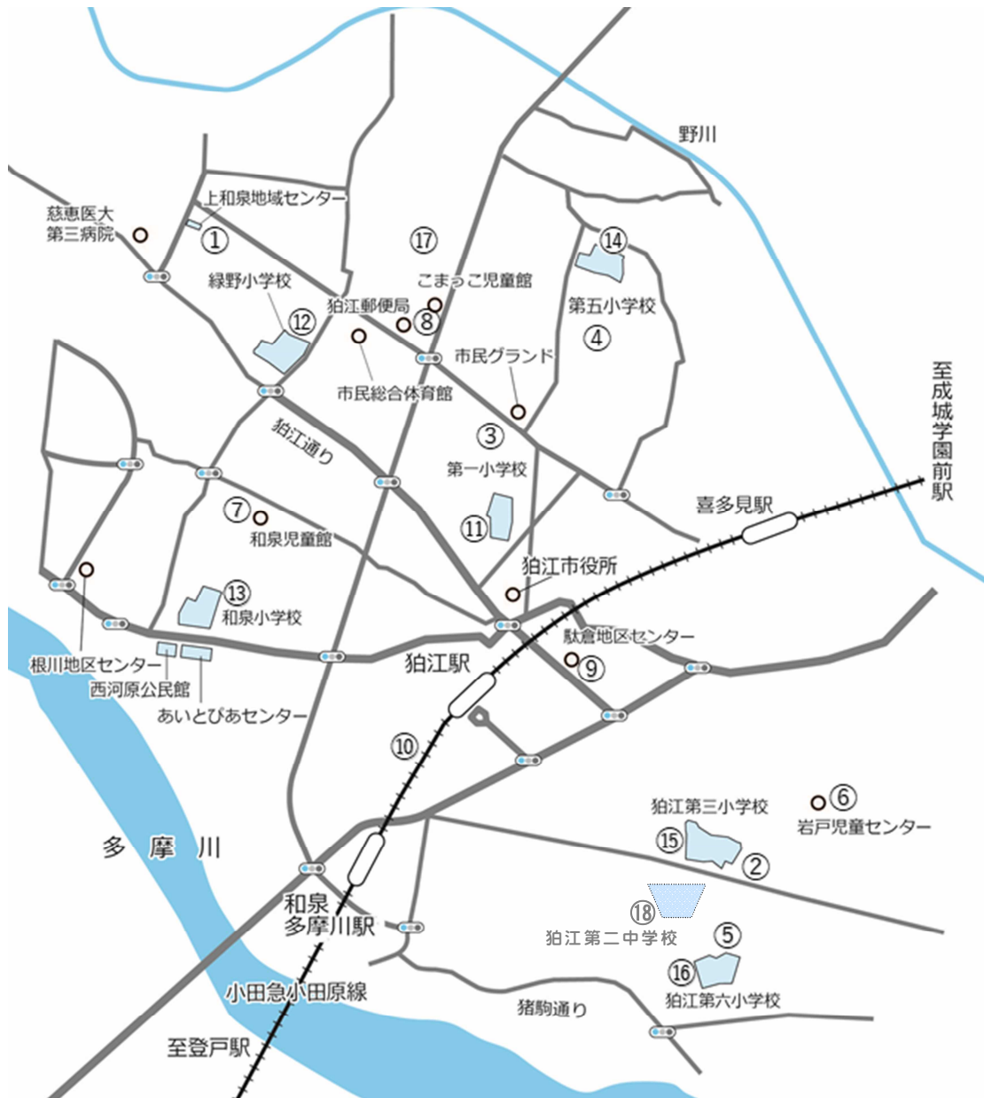
市内学童クラブ一覧