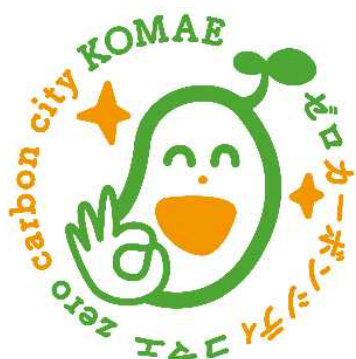
狛江市ゼロカーボンシティ推進 ロゴマーク