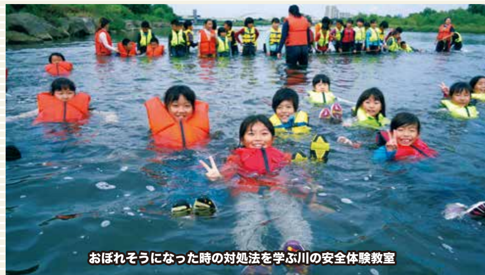
おぼれそうになった時の対処法を学ぶ川の安全体験教室