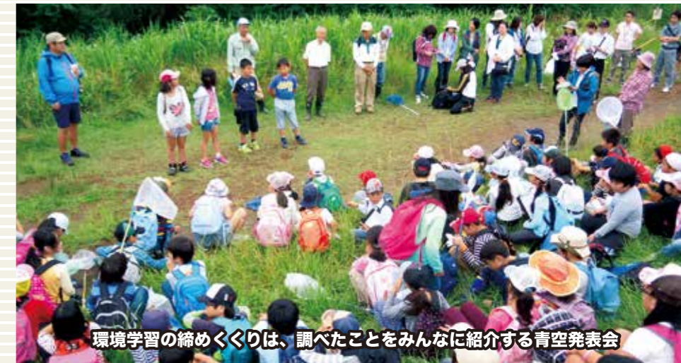
環境学習の締めくくりは、調べたことをみんなに紹介する青空発表会