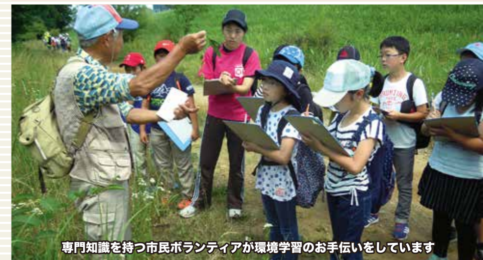
専門知識を持つ市民ボランティアが環境学習のお手伝いをしています