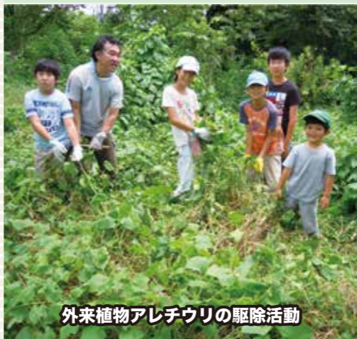
外来植物アレチウリの駆除活動