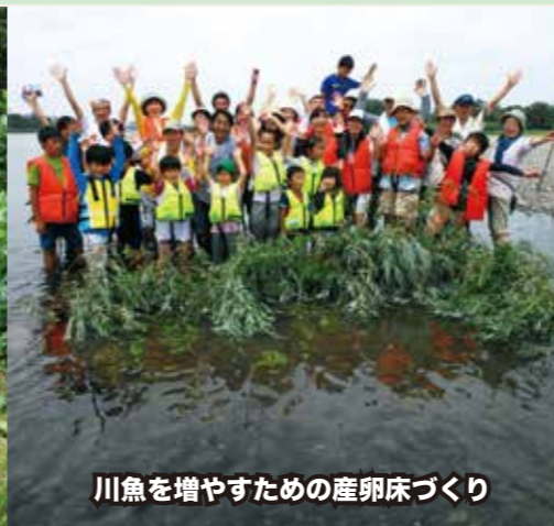
川魚を増やすための産卵床づくり