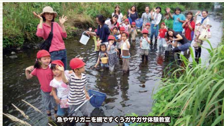
魚やザリガニを網ですくうガサガサ体験教室